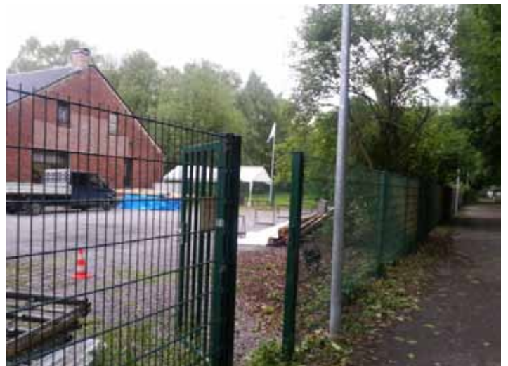
kurz vor der Kläranlage ist das Fußgängertor und die derzeitige Zufahrt. Bitte niemanden zuparken.