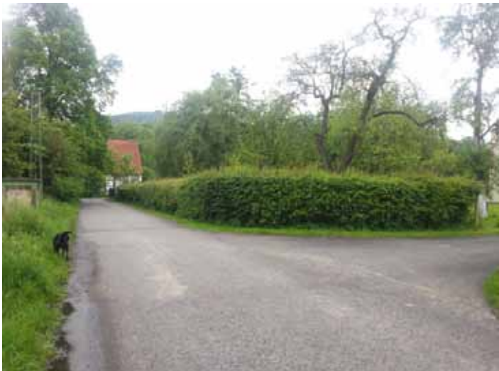
vorbei am schönen Gut Rocholz bis zur nächsten Ecke (Foto: Fachwerkhaus), dort rechts