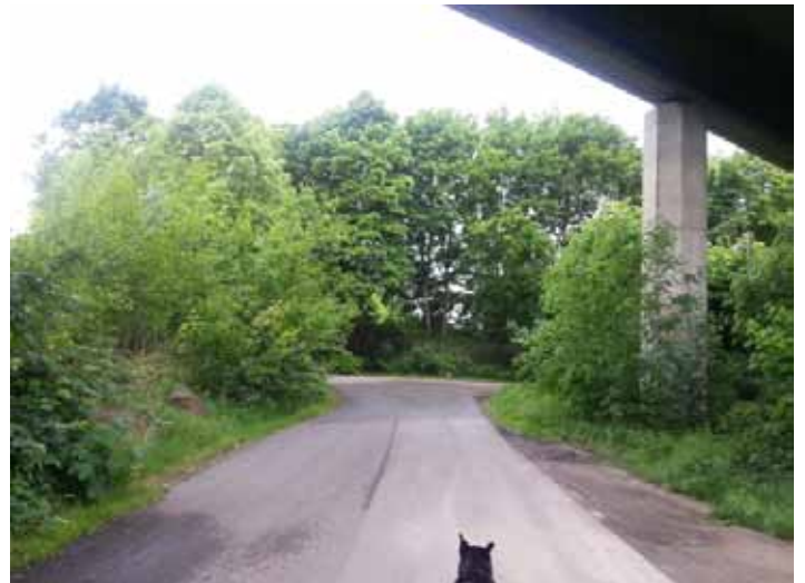
unter der Eicholzstraßenbrücke hindurch, dann links