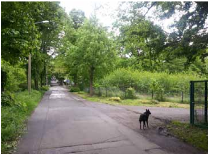
direkt rechts hinter dem Zaun ist die Zufahrt zu unserem Gelände (Foto: gesperrte Ennepebrücke voraus)