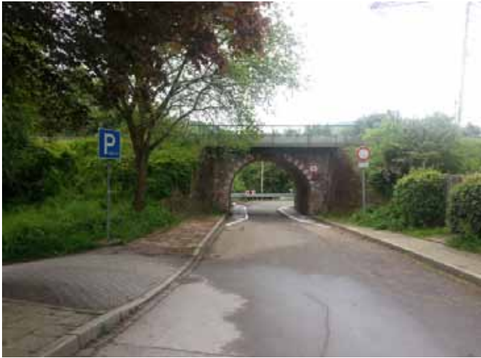
Berchem-Allee - hier abbiegen (links Parkplatz, rechts Friedhof) und unter der Brücke durchfahren