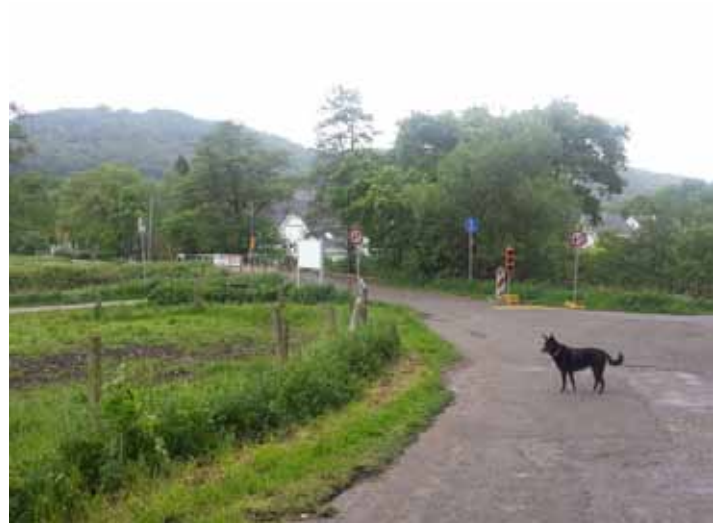
Weggabelung - links Höhenvieh rechts Spazierweg - hier geradeaus über die Schranken (Ampelanlage)